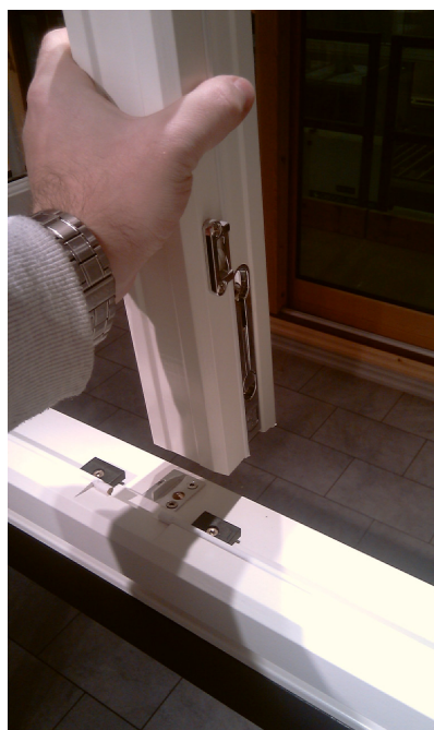
Hold fast i posten og skyv den ut. Den vil nå løsne både i nedre og øvre kant. Ta den inn i rommet. Vinduet er nå fritt med stor nok rømningsåpning