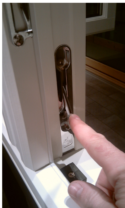
Åpne skåten ved å flytte hendelen fra øvre til nedre stilling