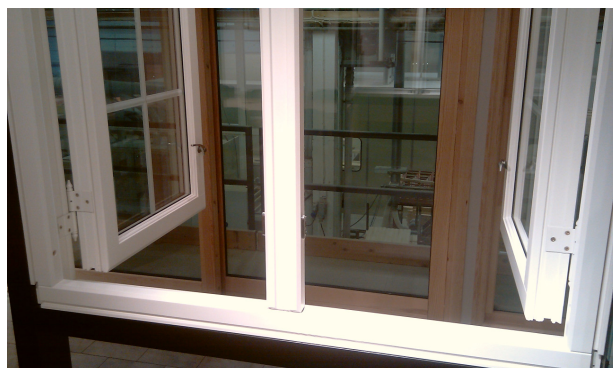
Åpne begge vindusrammene ved rømningsposten